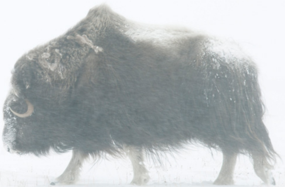
Boeuf musqué dans une tempête de neige, île Banks Colombie-Britannique